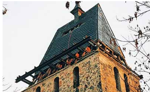
Abb. 6: Kirchturm in Zschortau: Zusätzliche Stahlträger an den Sparren ...