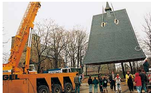
Abb. 7: ... und Montage des wieder hergerichteten Turmdaches, wozu für den Mobilkran ein unbedingt notwendiger Einsatzbereich gefunden wurde

Dazu wurden an allen Sparren doppelte U-Profile mittels Dübeln befestigt und sodann am Rand mit einem I-Profil verbunden. An diesem I-Profil konnten die Seile des Kranes angeschlagen werden. Der abgehobene Turm konnte anschließend auf Betonblöcken aufgelagert werden.