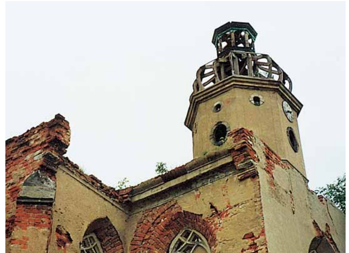
Abb. 2: Kirchturm in Schönwolkau: Ruine vor Wiederaufbau ...

Der Kirchturm zu Zschortau (Landkreis Eilenburg/Delitzsch) verfügt über ein steiles Satteldach mit beidseitigem Walm. Diese Konstruktionsform, der Grad der Schädigung und die gewünschte Auflagerung des abzuhebenden Turmes auf Betonblöcke machten eine zusätzliche Stützkonstruktion aus Stahl an den Sparren erforderlich (Abb. 6).