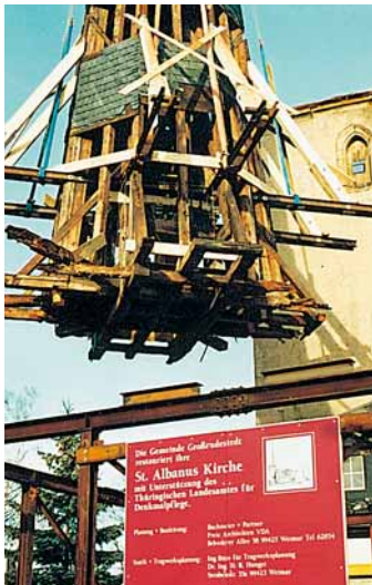
Abb. 4: Kirchturm in Großrudestedt: Anheben mittels eingebauter U-Profile ...