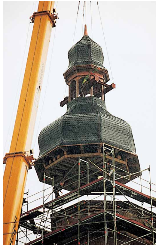
Abb. 3: ... und Kranmontage der neu erstellten Turmhaube