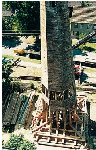
Abb. 5: ... und abgesetzt auf Schnürboden mit saniertem Balkenkreuz