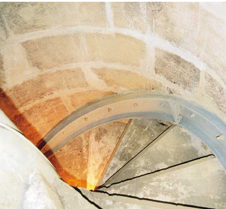
Abb. 4: Statische Sicherung des Treppenturmes mit einer vor Ort geformten Spirale aus Stahl-U-Profilen

Dazu wurde beidseitig des Risses schräg mit \varnothing 40 mm gebohrt, so dass die Nadeln ( \varnothing 12 mm aus Edelstahl) den Riss kreuzen. Der Abschluss des Turmschaftes bildet ein Stahlbeton-Ringbalken, der die Mauerkrone stabilisiert und gleichzeitig als Auflager für die Turmhaube dient (Abb. 5).