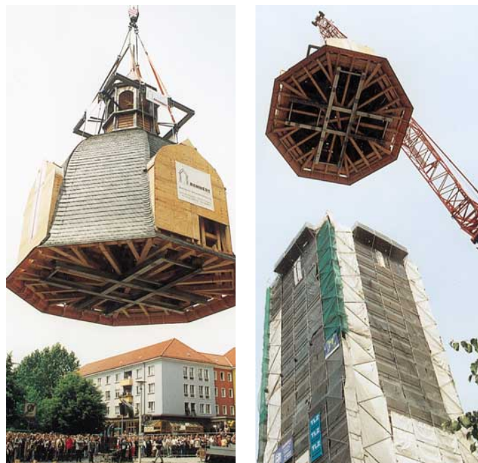
Abb. 8 + 9: Montage-Traverse für den Kranhub der Turmhaube und ihr Anheben auf den Turmschaft in 52 m Höhe