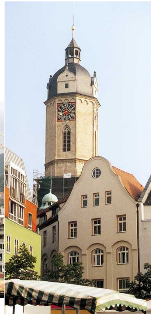
Abb. 1+2 : Zustände des Turmes vor Beginn der Sanierungsarbeiten und bei Abschluss im Sommer 2001 mit Kupferkugel und stählernem Kreuz

Der Jenaer Kirchbauverein e.V. engagiert sich seit seiner Gründung für die Sanierung der Stadtkirche St. Michael in Jena, um sie wegen ihrer baugeschichtlichen Bedeutung und als Wahrzeichen zu erhalten.