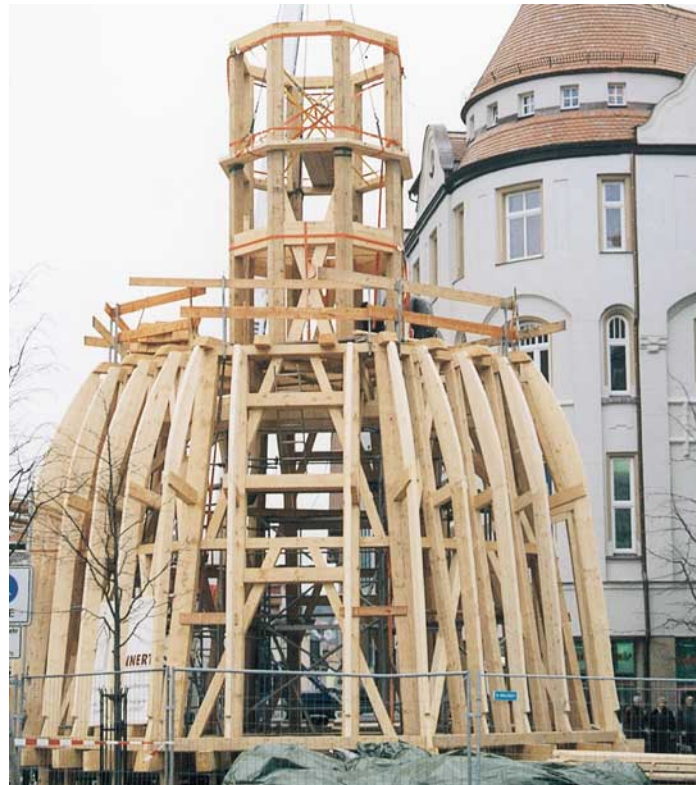
Abb. 7: Zimmerkonstruktion der Turmhaube einschließlich Laterne und Schablonen

Zwei Wochen später, am 26.05.2000, wurde nach Abbau