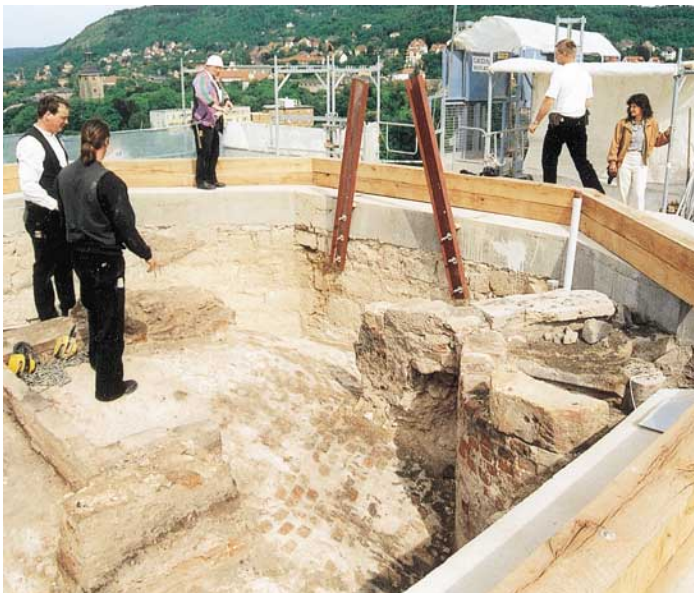
Abb. 5: Vorbereitete Mauerkrone mit Ringbalken und Eichenschwellen