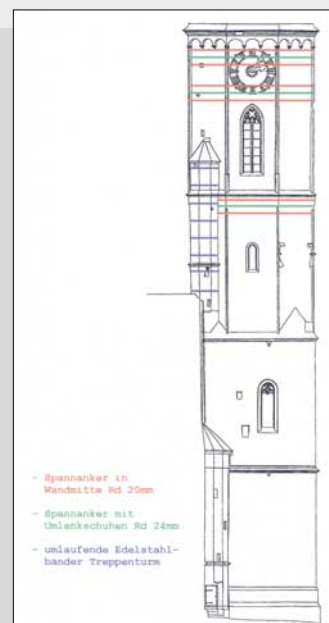
Abb. 3: Übersicht Spannankerebenen und statische Sicherung des Treppenturmes

Grund für einen gewünschten Umbau der Aufhängung ist der bessere Klang der Glocken.