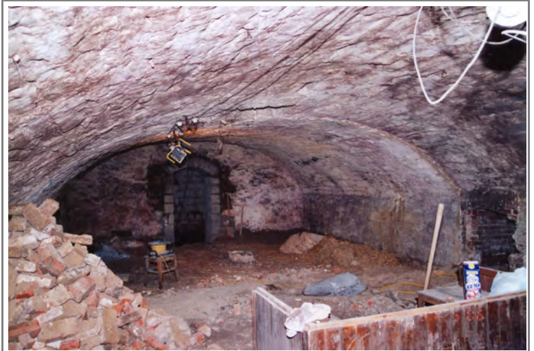
Gewölbekeller vor Umbau

Umbau historisches Tonnengewölbe zum Veranstaltungskeller Johannisstr. 13, 07743 Jena