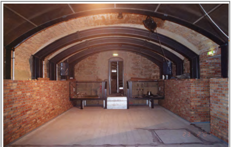
Gewölbekeller nach Umbau