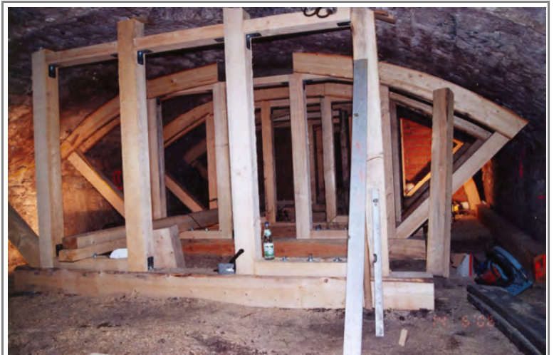
Abstützkonstruktion während der Bauphase

Zur Umnutzung eines vorhandenen Tonnengewölbes in einen Veranstaltungsraum des Studentenclubs Rose wurde das Fußbodenniveau um 1,50 m tiefer gelegt. Dazu mußten umfangreiche Unterfangungsarbeiten in Stahlbetonbauweise durchgeführt werden. Zur Sicherung des Gewölbes sind Stahlträger verwendet worden.