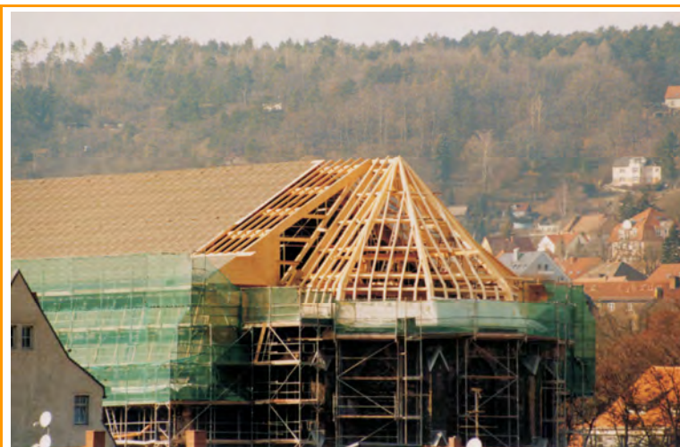
Blick auf das Chordach