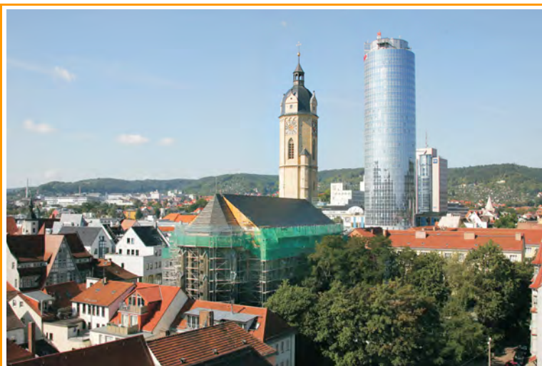
Blick von Nordosten

Neubau des Turm-, Schiff- und Chordaches Kirchplatz, 07743 Jena